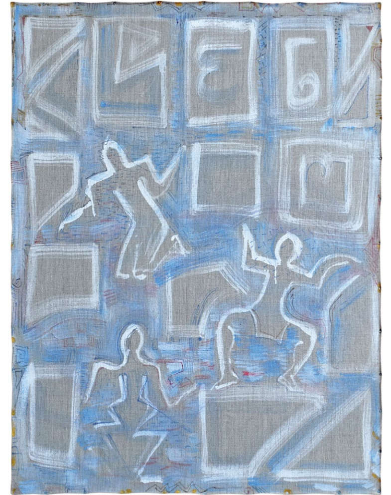
miroslava trizuljaková tanec III , 2023, kombinovaná technika, 110 × 83 cm