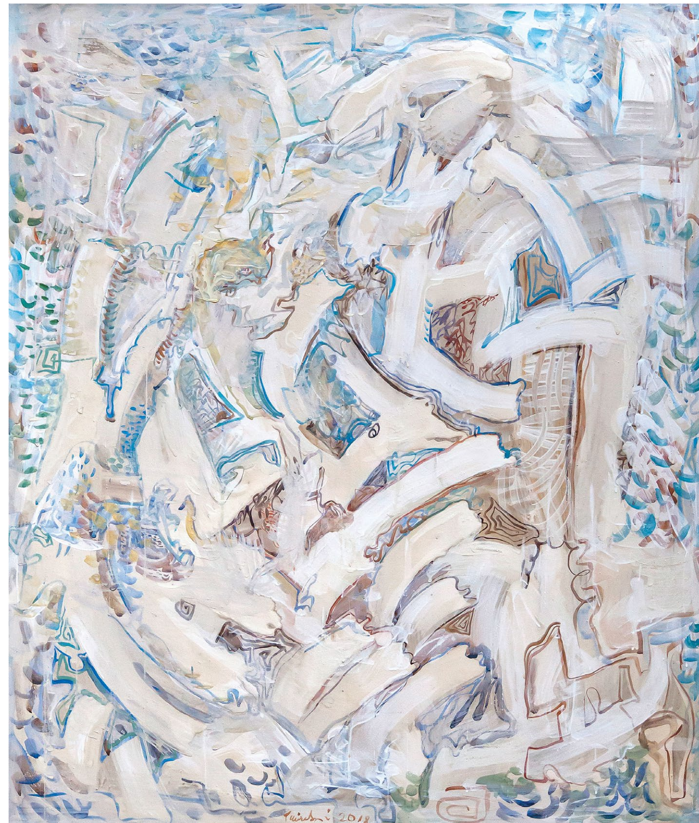
miroslava trizuljaková tanec II , 2018, akryl na plátně, 100 × 85 cm