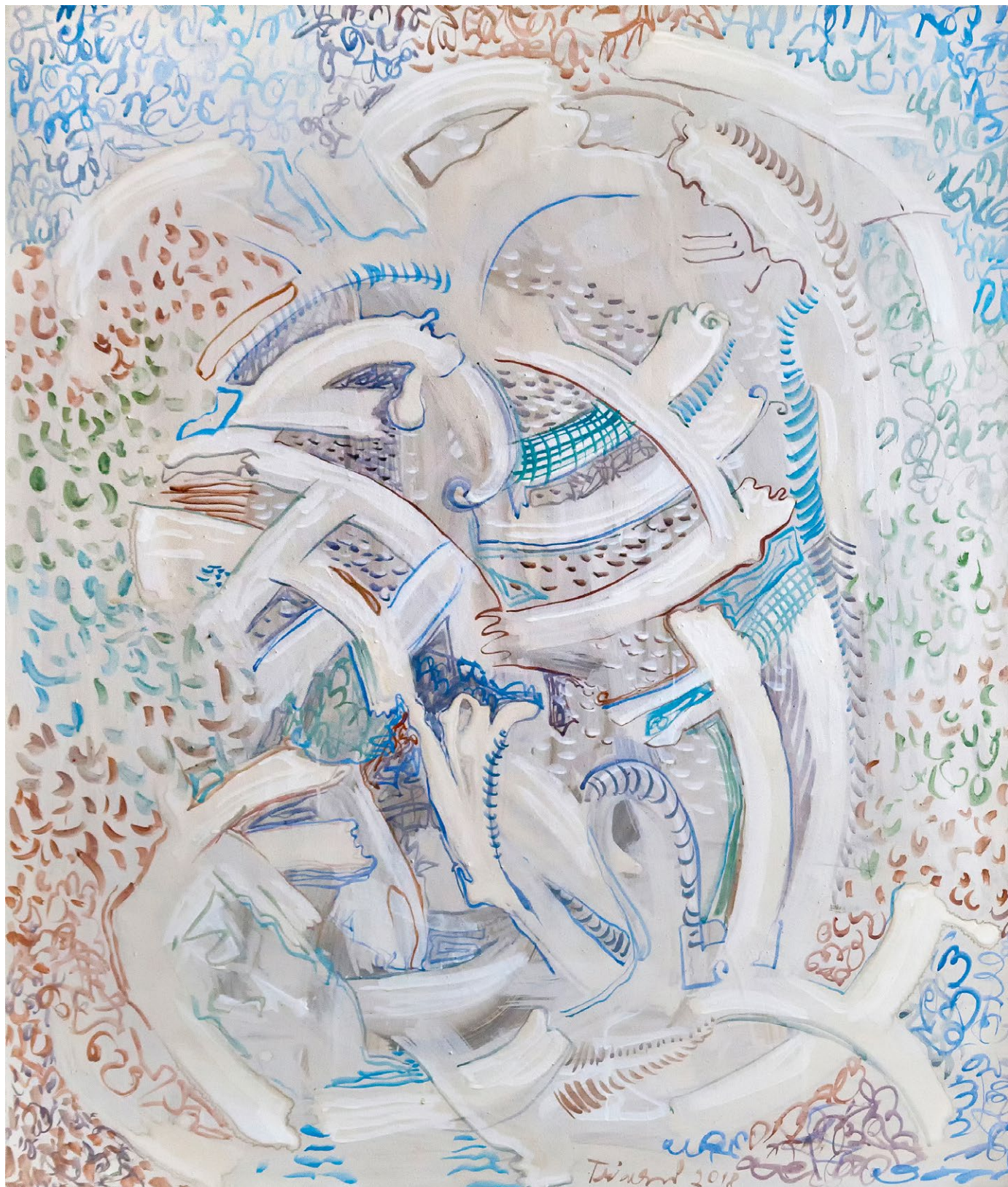
miroslava trizuljaková tanec I , 2018, akryl na plátně, 100 × 85 cm