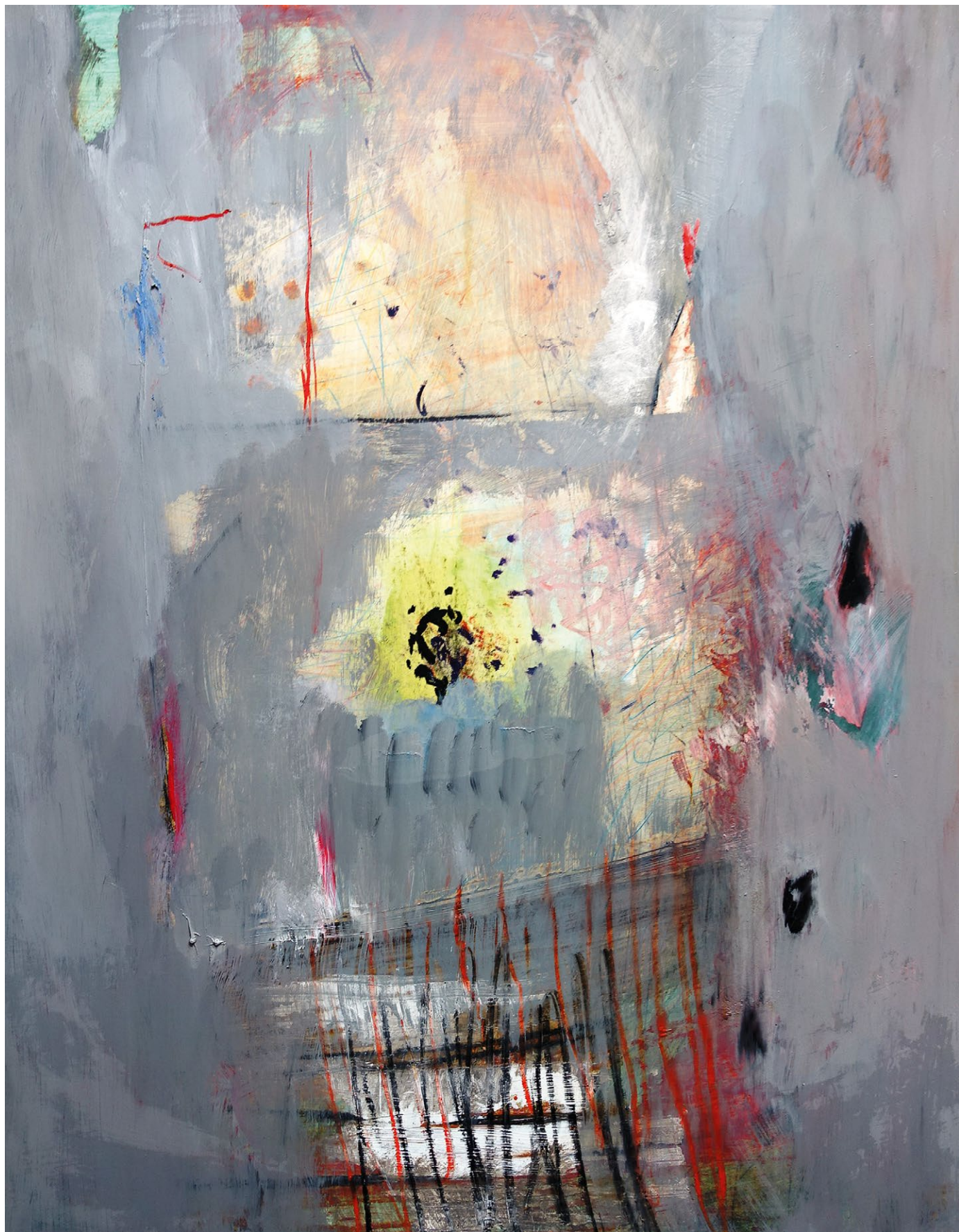
zdena höhmová křehký prostor , 2023, olej a kresba na chromonáhradě, 90×70 cm