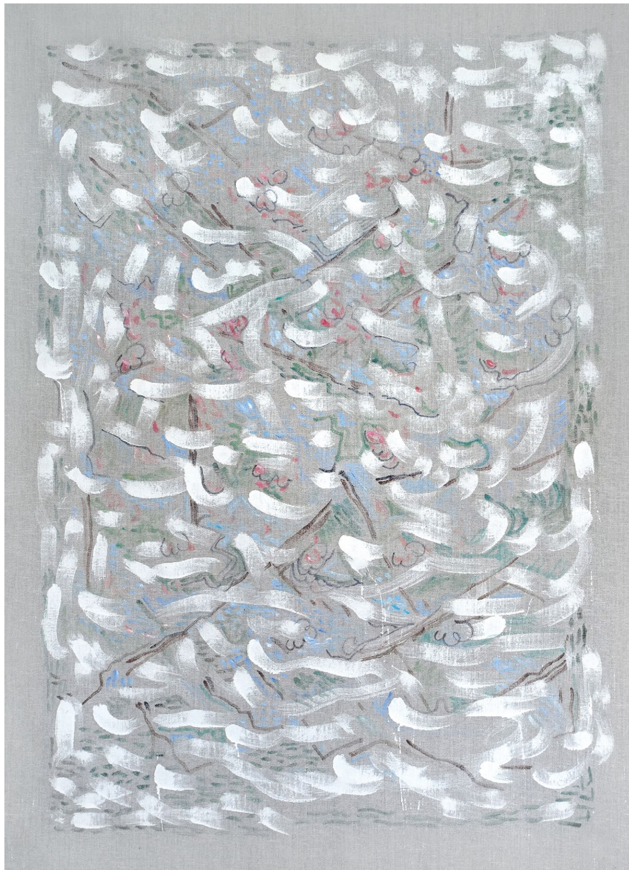
miroslava trizuljaková čekání na jaro , 2022, akryl na plátně, 154×114 cm