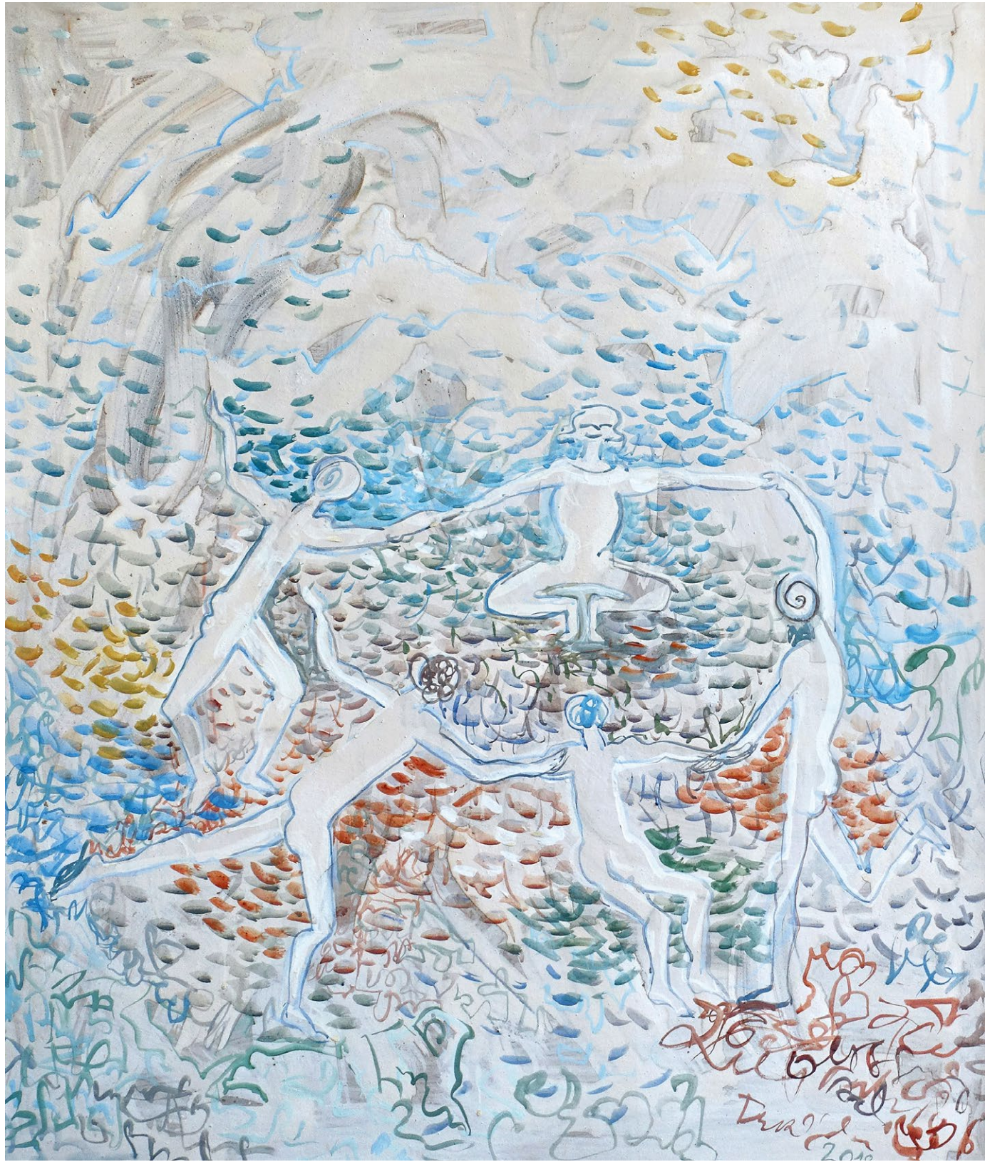
miroslava trizuljaková tancujeme , 2018, akryl na plátně, 100 × 85 cm