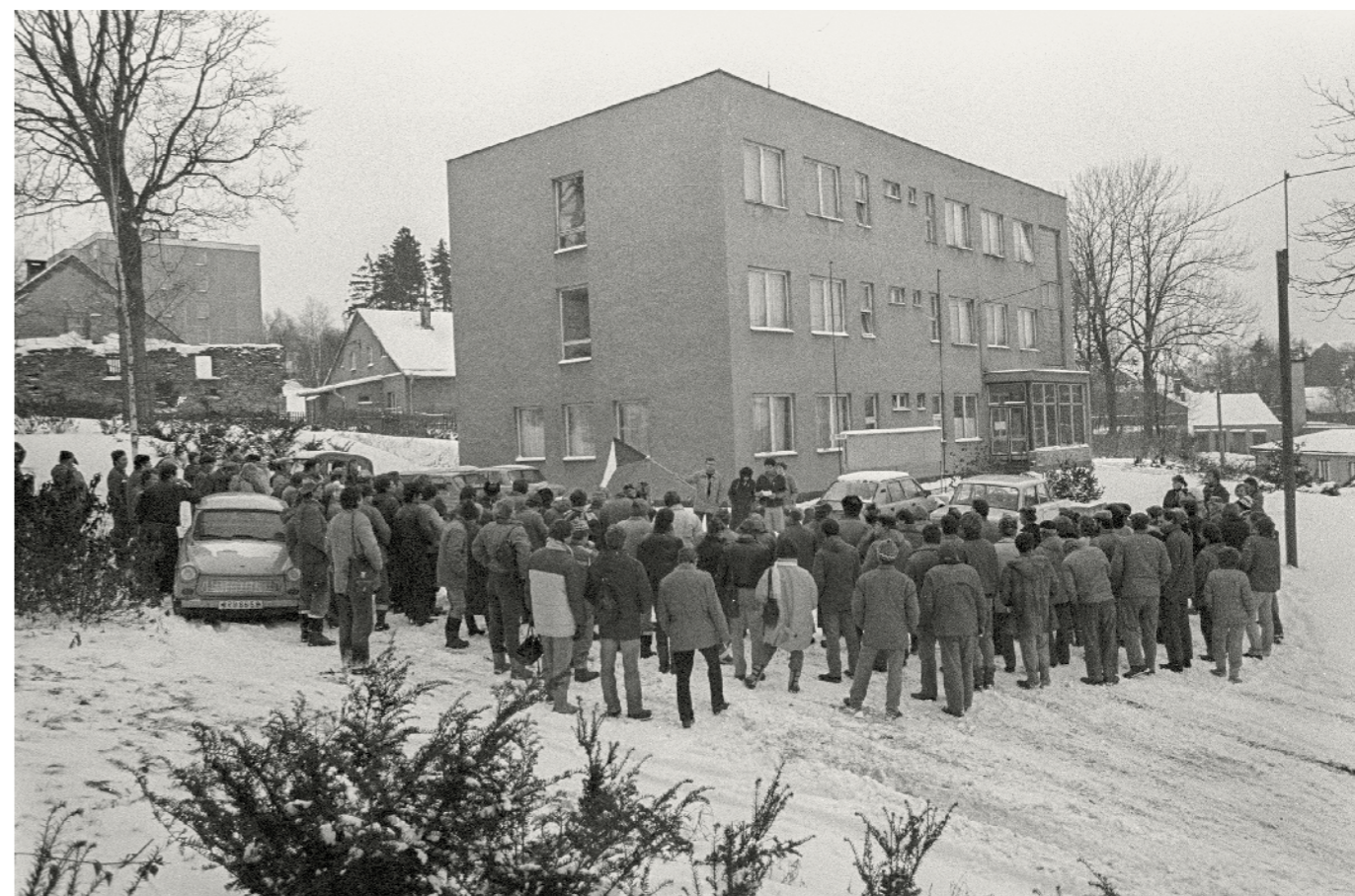
jindřich štreit – ryžoviště, 28. 11. 1989