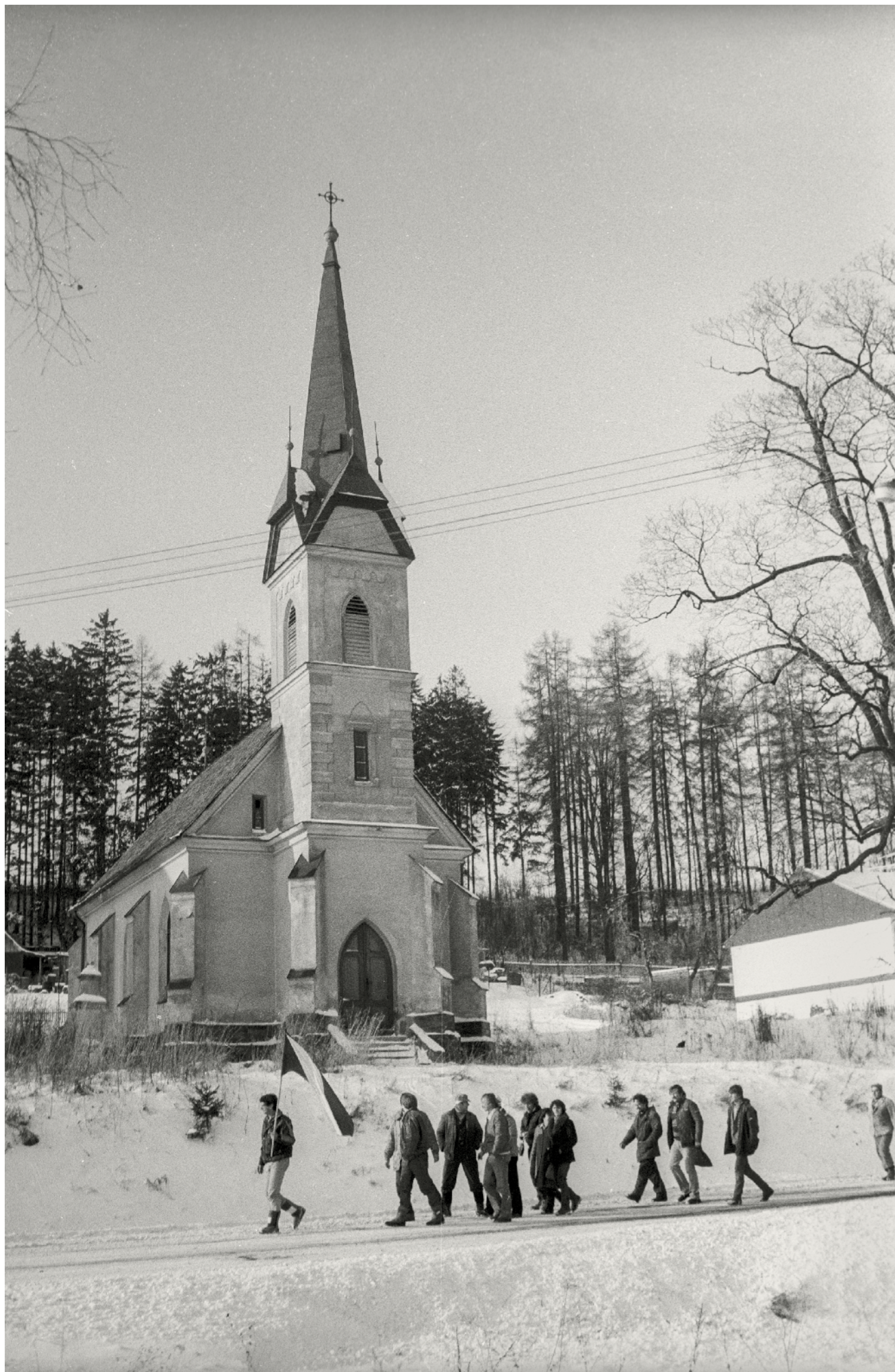
titulní strana jan šibík – bezpráví, leden 1990 k obci s příznačným jménem začali lidé svážit symboly padlého režimu