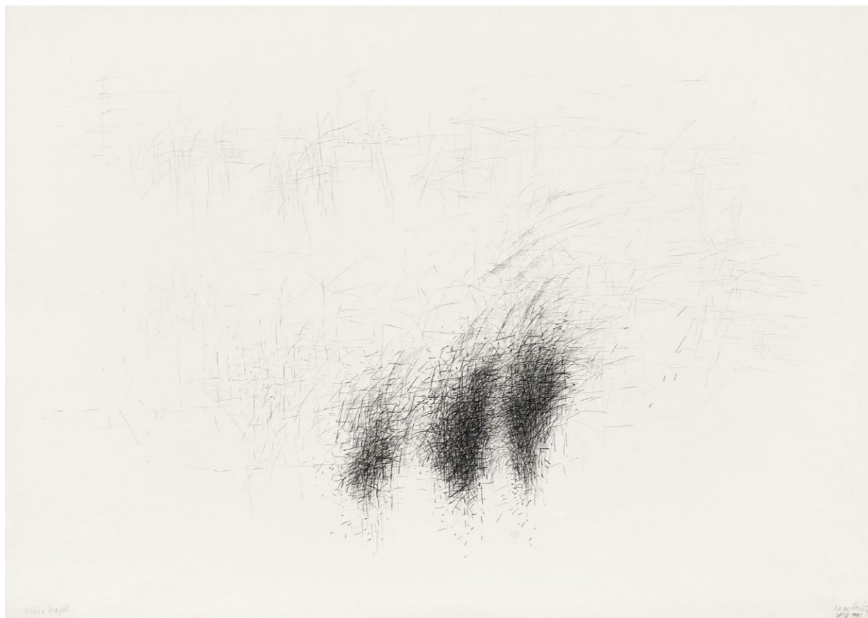
stromy, 2. 5. 1991, tuš, pero, papír, 597 × 840 mm