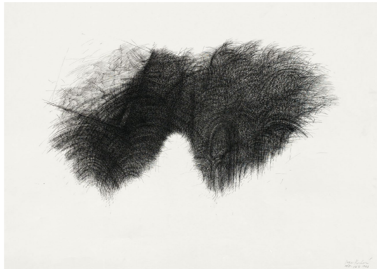
klenby, 11. – 16. 5. 1995, tuš, pero, papír, 597 × 840 mm