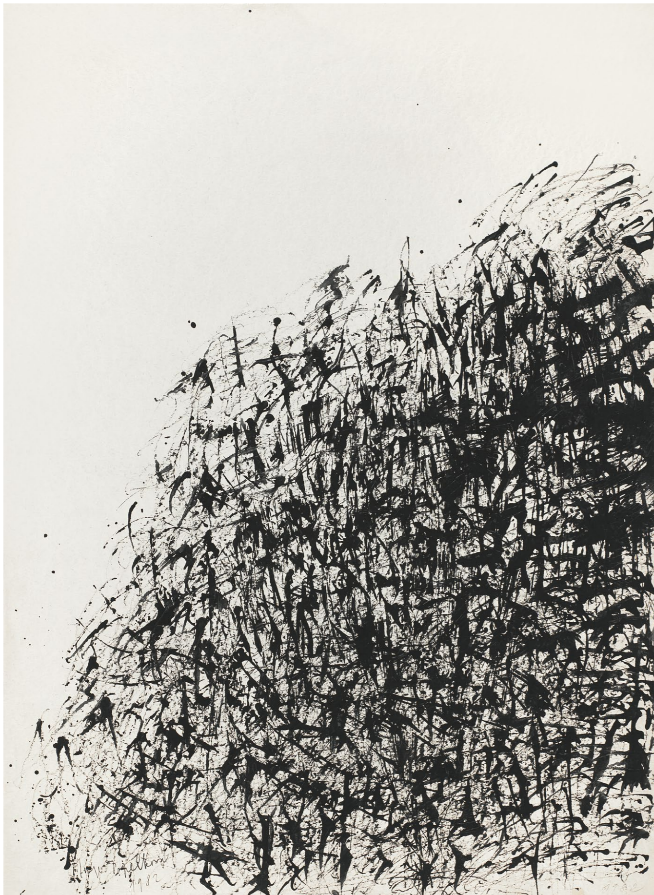
strom, 1982, tuš, dřívko, papír, 904 × 660 mm