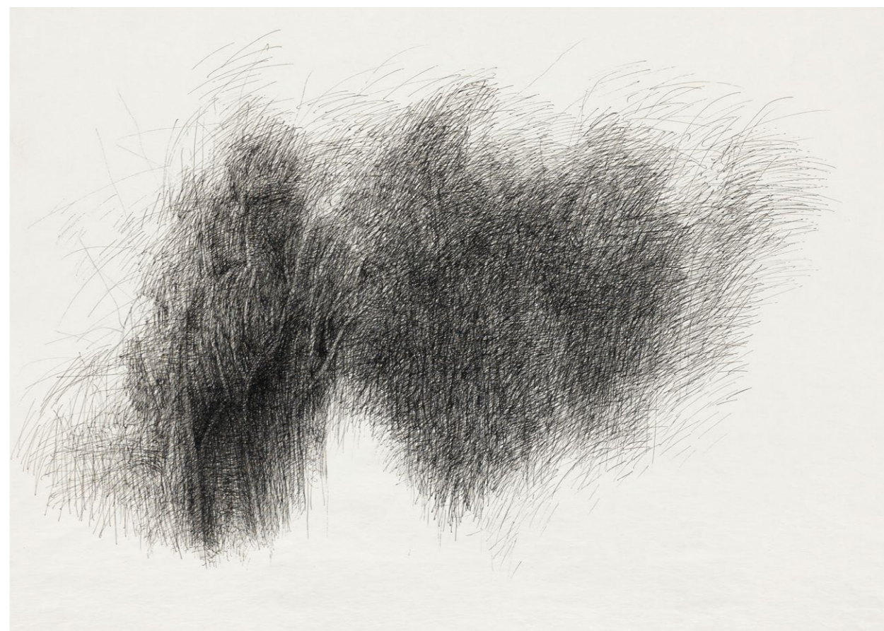
stromy, 23. 10. 1988, tuš, pero, papír, 597 × 840 mm