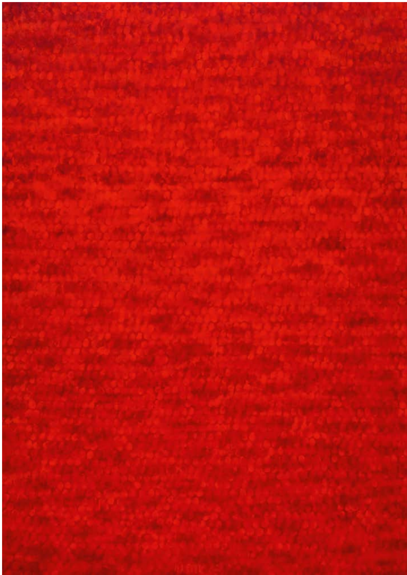
doteky, 2010, olej na plátně, 120 × 85 cm