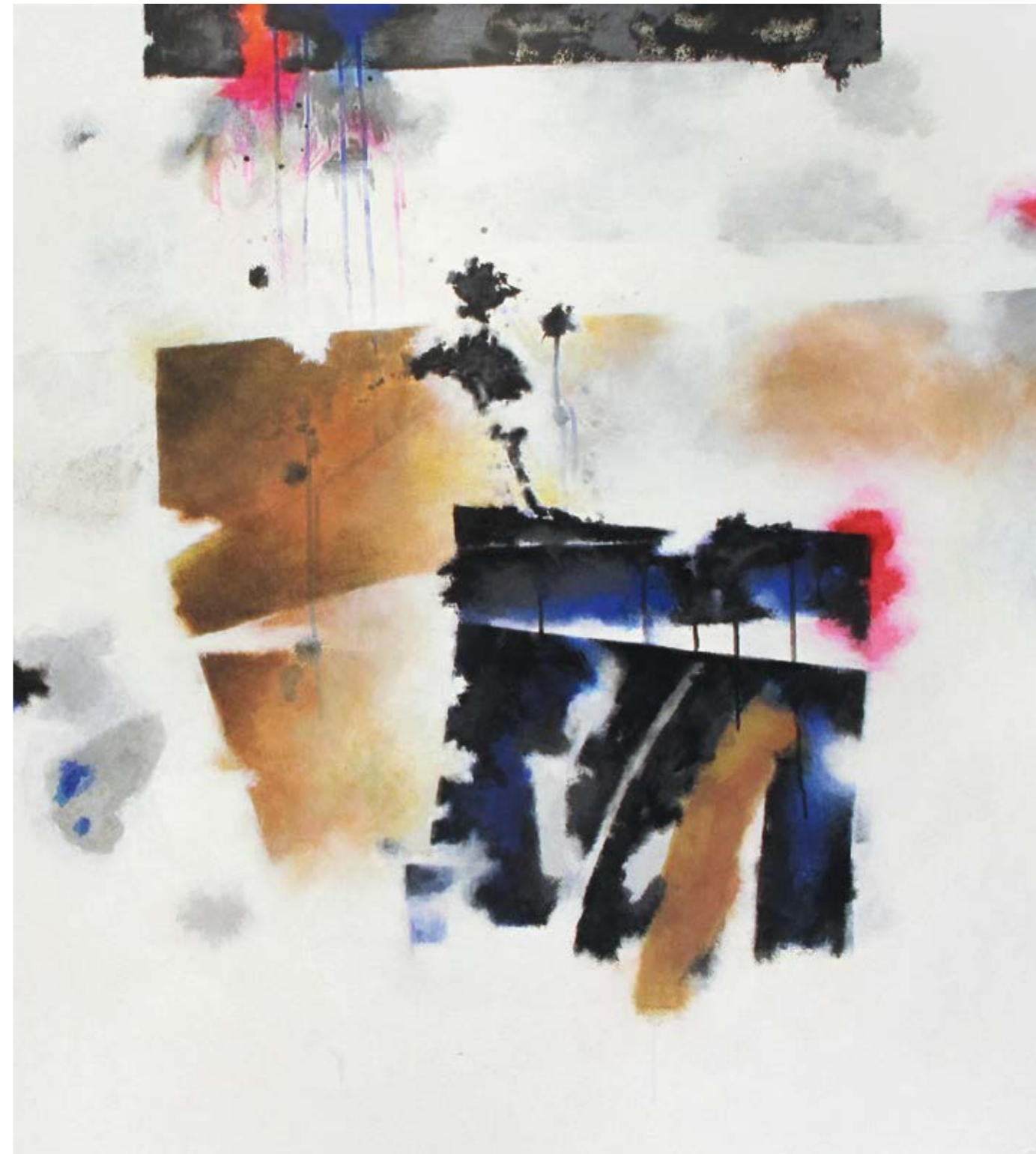
< fragments of memory IV, 2016, akryl na plátně, 100 x 90 cm fragments of memory II, 2016, akryl na plátně, 100 x 90 cm