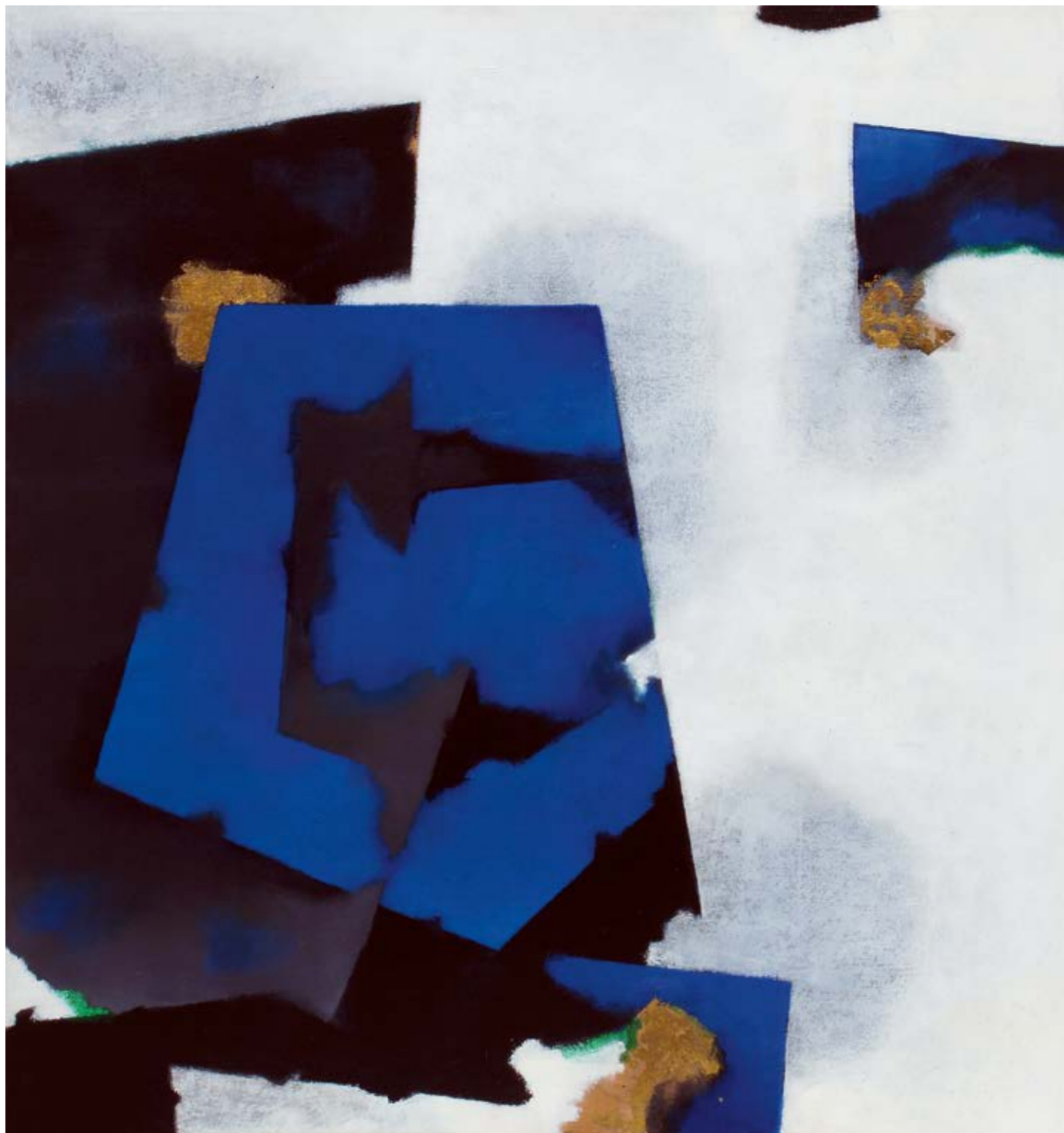
paměť kamene I, 2013, olej na plátně, 70 × 70 cm

ve svém díle řeší střetání očividných znaků dnešní společnosti se zafixovanými nánosy kulturní povahy. volí si pro to vypjaté, psychologicky náročné situace, jež podrobuje téměř laboratorní analýze. používáním celé škály znaků a symbolů a jejich bezprostřední konfrontací s citacemi syrové reality dosahuje až příznačné emocionality. jeho měření a zkoumání lidských dimenzí, především v oblasti schopnosti uchování či naopak nalézání identity, posunuje vyznění jednotlivých děl k hranicím sociálního působení. vědomí relativnosti, ne snad hodnot, ale jejich interpretace, jej často v dalších významových rovinách