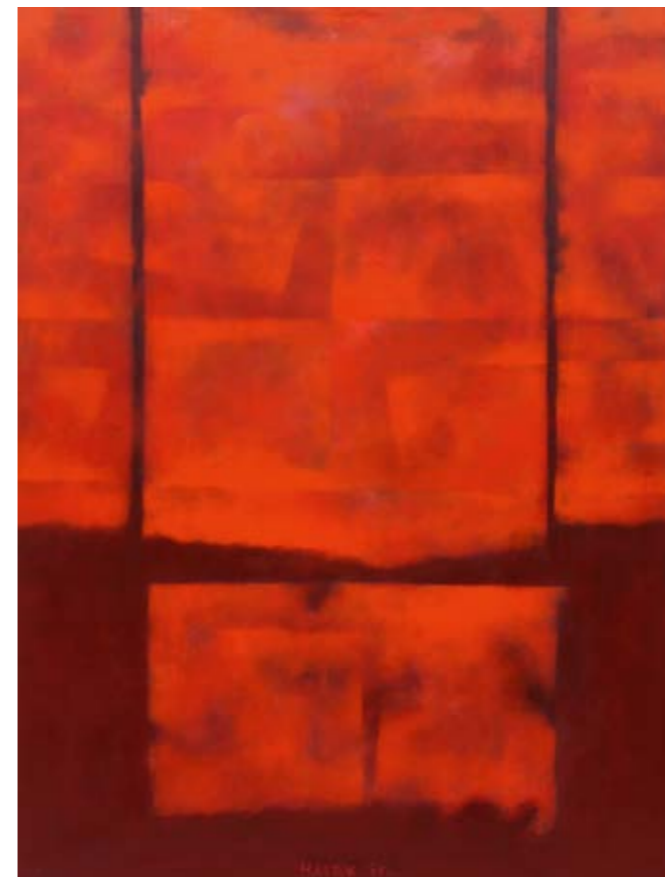
hledání řádu II, 2010, olej na plátně, 105 × 80 cm

od návštěvy izraele nabývají i jednoduché tvary v jeho obrazech podobu praznaků. snad právě tam byl nejsilněji osloven střetem kulturních a civilizačních faktorů, několika