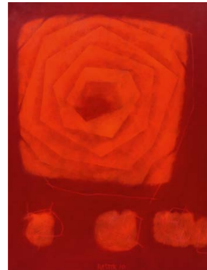
stigma, 2010, olej na plátně, 105 × 80 cm

svobodné rozvíjení ducha v prostoru, který není předem okupován neurotickými aspiracemi, rozvíjení ducha nezátíženým přemýšlením o užitečnosti a žádostivosti, je snad jen utopií východoasijské kultury a je jedním z ideálů, jenž může být odvozen z tohoto postoje. s tím se