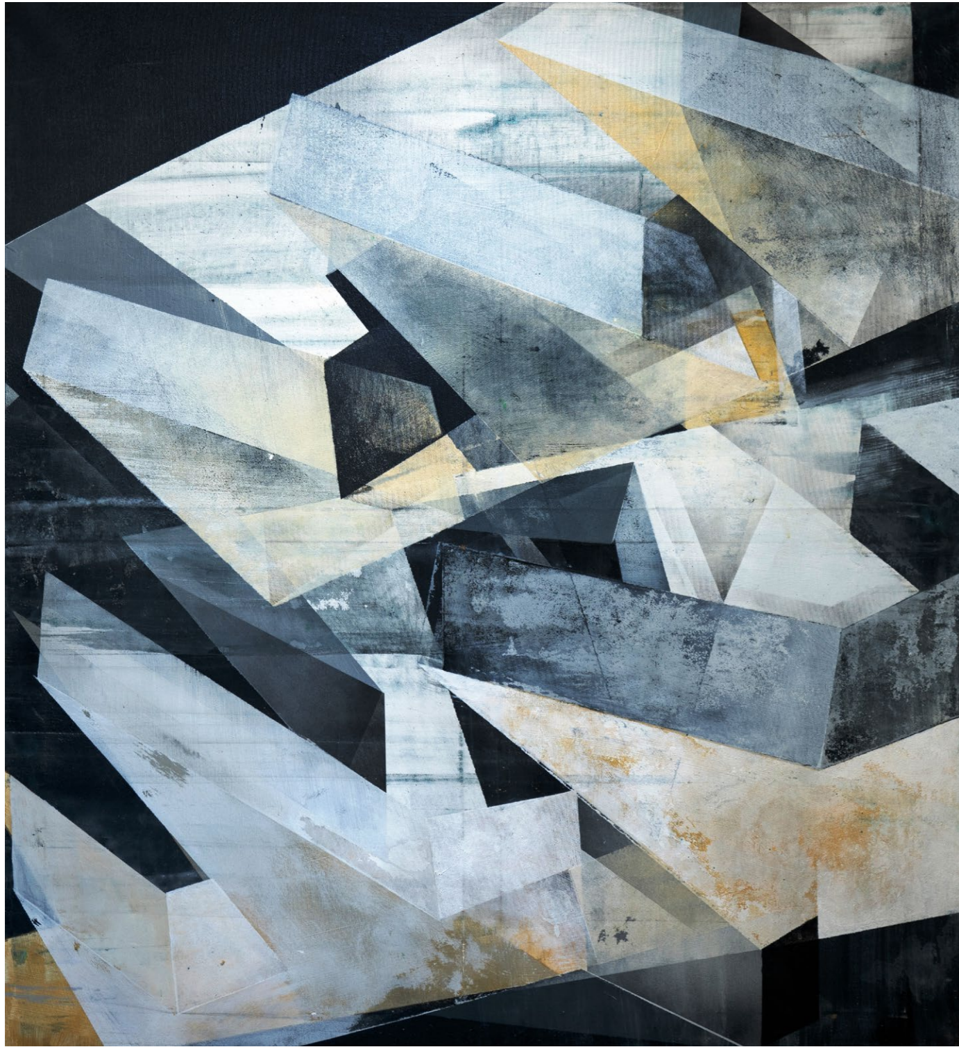
megastruktury , 2023 akryl na plátně, 120 × 110 cm