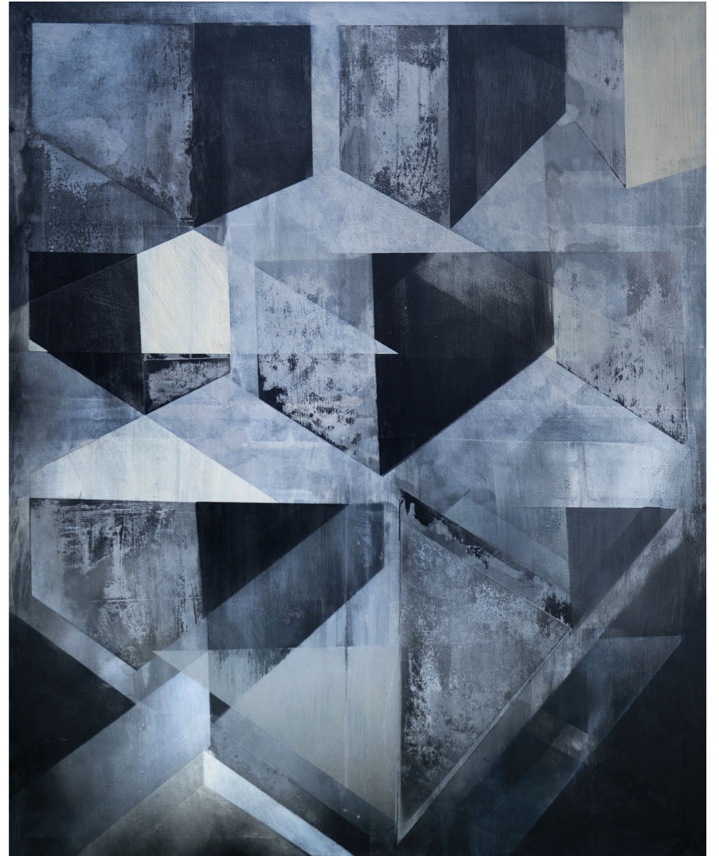
sídlíště , 2020 akryl na plátně, 100 x 120 cm