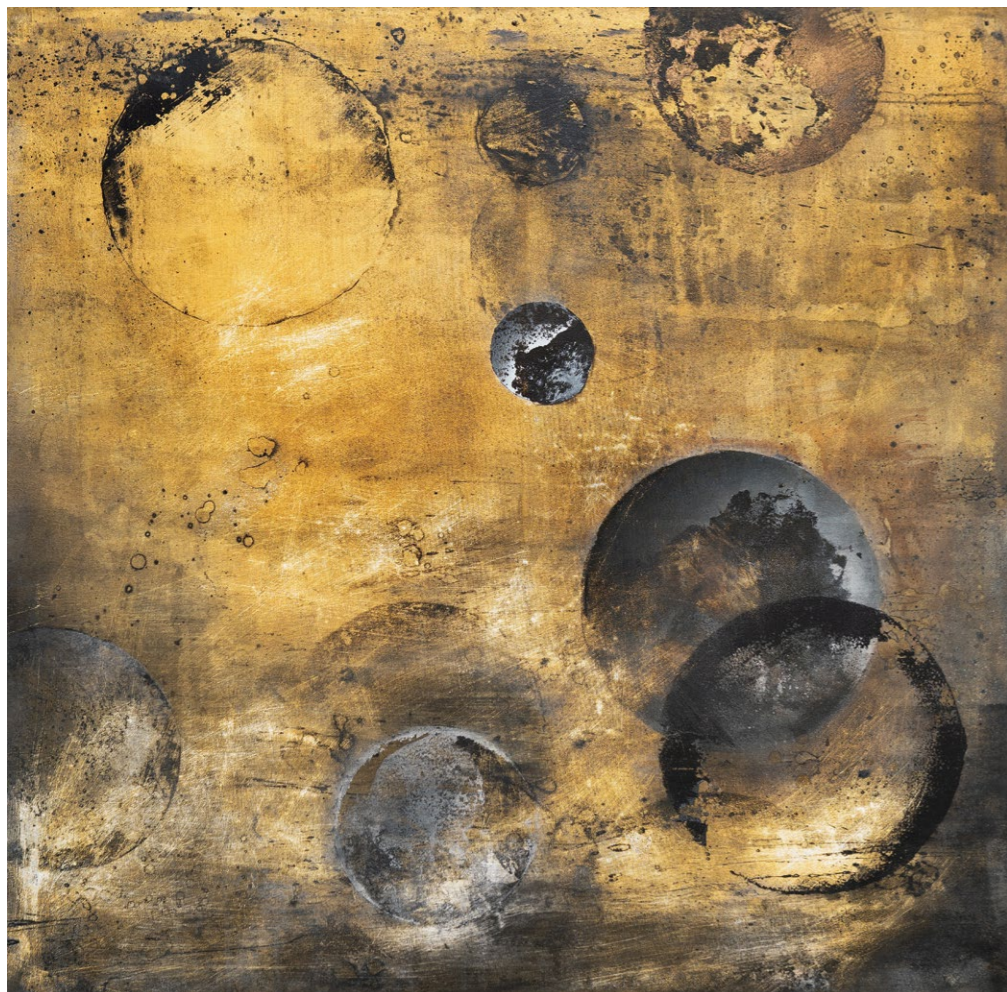
interiér 5 , 2015 akryl na plátně, 100 x 100 cm