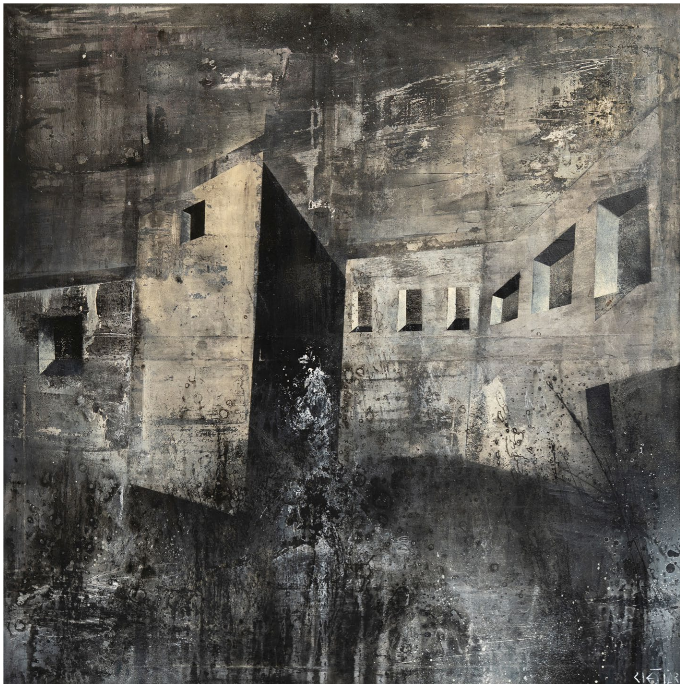
<< na titulní straně megastruktury , 2023 akryl na plátně, 150 x 150 cm